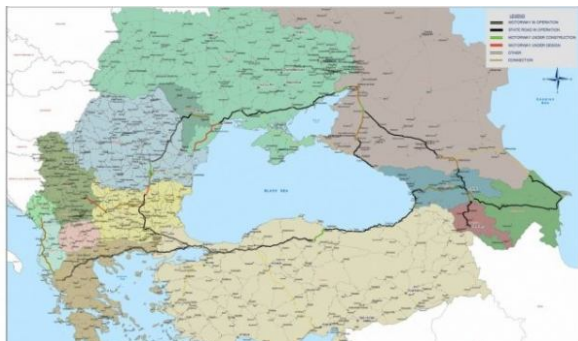
( T r a s e u l a u t o s)

Rusii au anuntat ca vor demara in acest an lucrarile de constructie a portiunilor de autostrada de pe teritoriul lor ( Krasnodar-Rostov pe Don si Nalcik-Vladikavkaz-granita cu Georgia ). Oficialii rusi au comunicat ca este asteptata si implicarea Uniunii Europene pentru portiunile din Romania, Bulgaria si Republica Moldova. Teoretic, totul ar putea fi gata in 2020.